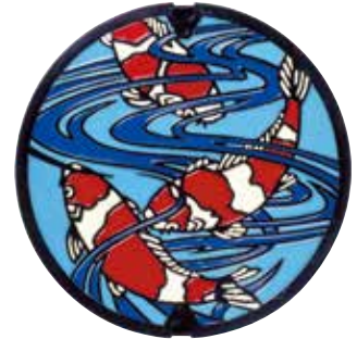
▲カラーリングカバー