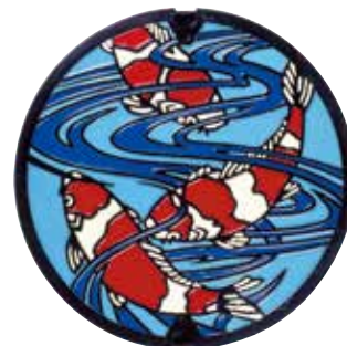
▲カラーリングカバー