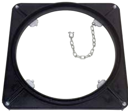
受枠 (落下防止網受座・クサリ付)