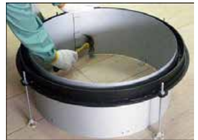
5 固定座に釘打ちをし打込型枠を固定する。