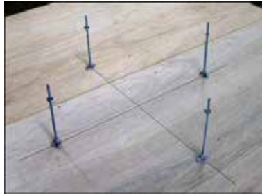
2 レベルボルトをアンカー孔位置に釘止め固定する。