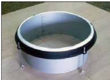
6 受枠周囲の溝にコンクリートが入らないよう養生材を押し込み取り付けを終了します。