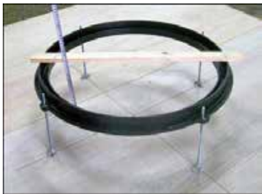
3 受枠をレベルボルトにセットし、ナットを回し仕上レベルに合わせる。

注 受枠をレベルボルトにセットしナットで固定する際は、受枠のレベル・歪みに注意して施工してください。