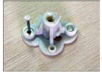
2.注 釘止めは、レベルボルト固定座の2重リング部で固定します。