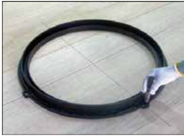
1 受枠を施工位置に置きアンカー孔位置に印を付ける。