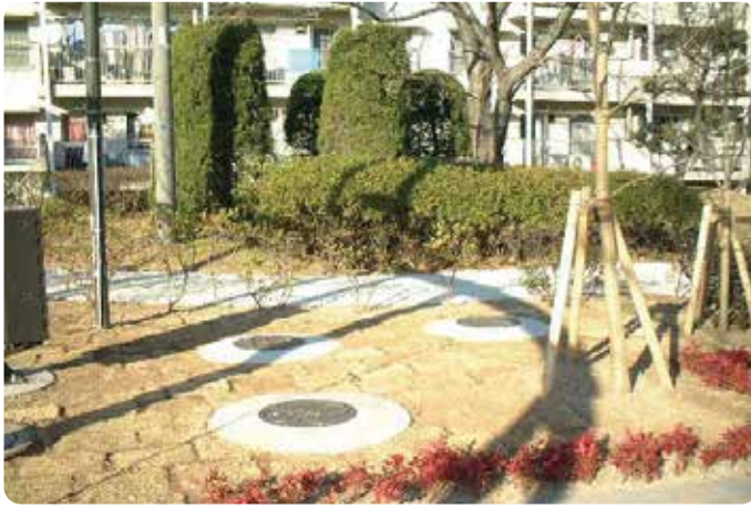
コンクリート巻き(丸)タイプ (テントブース収納)