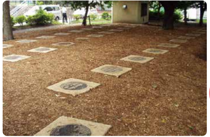
コンクリート巻き(角)タイプ (テントブース収納)