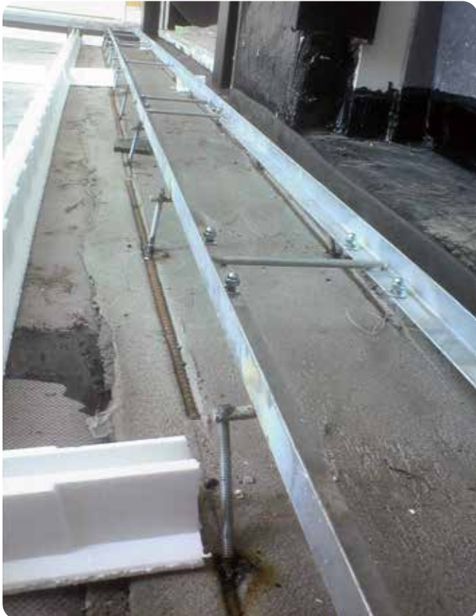
防水層がらみ受枠施工