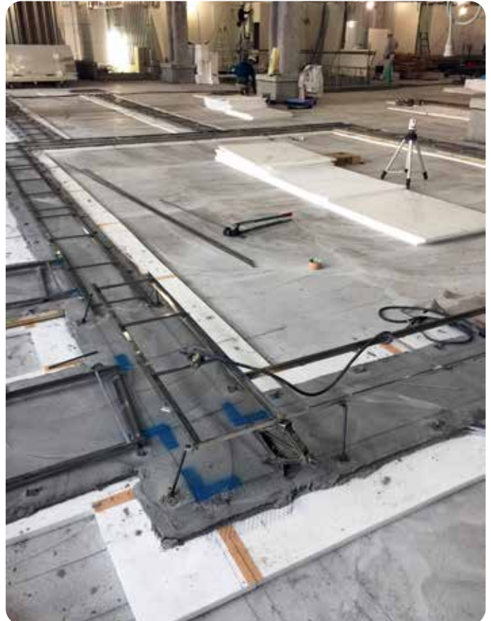
防振材がらみ受枠施工