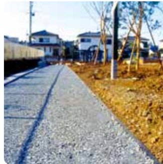
③ クラッシュランを転圧します。