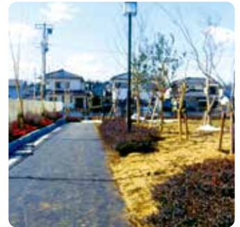
④ 舗装材(アスコン)を転圧します。