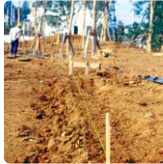
① 舗装仕上げ面の位置を墨出しします。