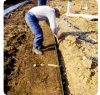
② 墨糸に沿ってアンカー打ちして位置を決めます。