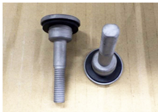
保護キャップボルト 4個