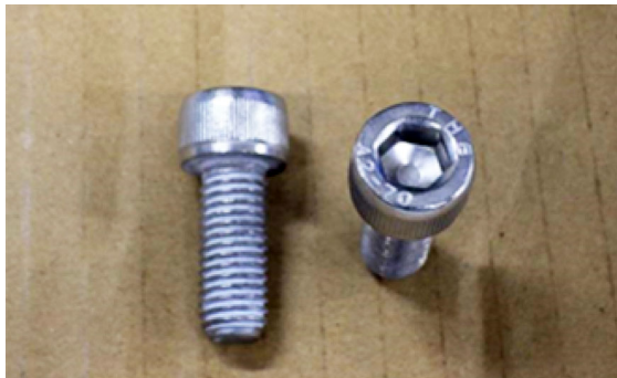
六角穴付ボルト 4本 (M10×25)