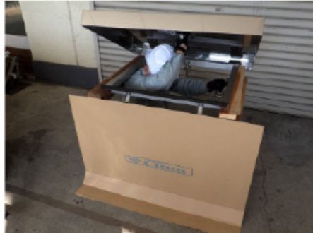
6. カバーを持ち上げて 開けます。