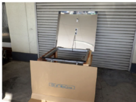
8. カバー開放状態・全景 ※カバーを閉める際は 開ける手順の逆で 閉めてください。 ●注意 屋上点検口カバーは、 開閉状態で放置しますと 破損の恐れがありますの で、ご注意ください。