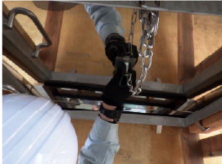
5. カバーの取手を握り カバーを持ち上げら れる姿勢をとります。