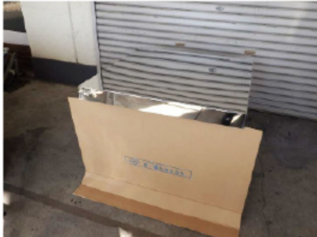
1. KT-S 全景 (上部側から)

屋上点検口カバーKT-Sのカバー開閉手順について、下記手順を記載しますご参考になさってください。