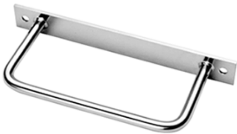
一般用タラップ W -1530SW

W -1530SW の壁面取り付け用のオールアンカーM10×70をご用意できます。